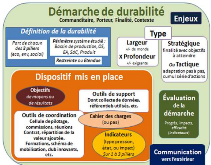
Figure 1 : Composantes de caractérisation d'une démarche de durabilité portées par les acteurs du monde agricole.

A. Schneider, M.-B. Magrini, E. Montrone (2015).